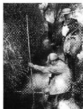
Fotografía 1. Recopilación de información, aforo de caudales y encuestas a consumidores del Directorio de Aguas de la Acequia Troya.