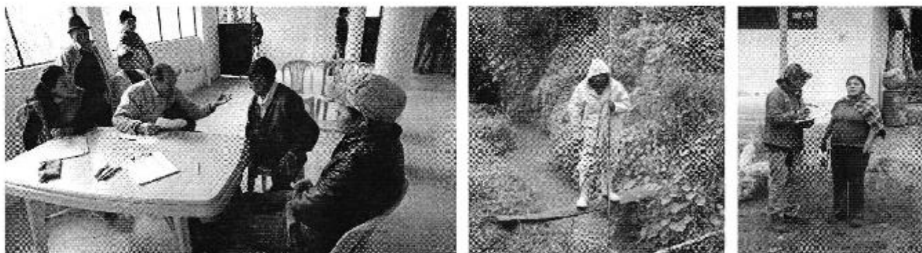
Fotografía 4. Recopilación de información, aforo de caudales y encuestas a consumidores del Directorio de Aguas de la Acequia Illina Las Viñas.