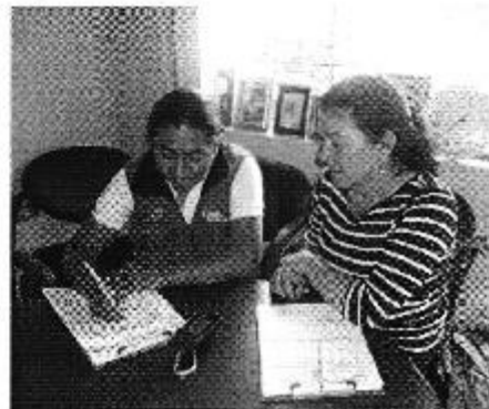
Fotografía 3. Recopilación de información, aforo de caudales y encuestas a consumidores del Directorio de Aguas de la Acequia Jones o Mortensen Samaniego.