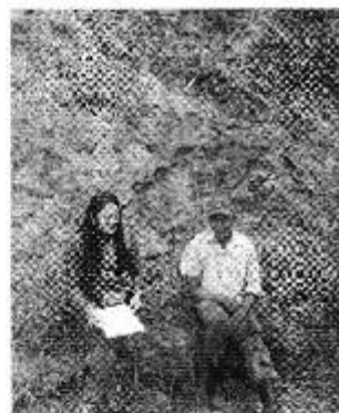
Fotografía 2. Recopilación de información, aforo de caudales y encuestas a consumidores de la Comuna San Martín.