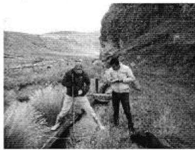
Fotografía 2. Der. Reunión de trabajo, izq. Visita al sitio de captación y medición del caudal del sistema de riego del Directorio de Aguas de la Acequia Torre Quilua.