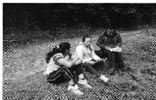
Fotografía 4. Der. Reunión de trabajo, Izq. Recopilación de información y aplicación de la ficha técnica de investigación de campo a los dirigentes del Directorio de Aguas de la Acequia Loroguchana El Molino.