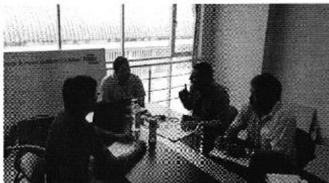
Fotografía 3. Reunión con el Coordinador de la Unidad de Ambiente GADM-El Guabo.