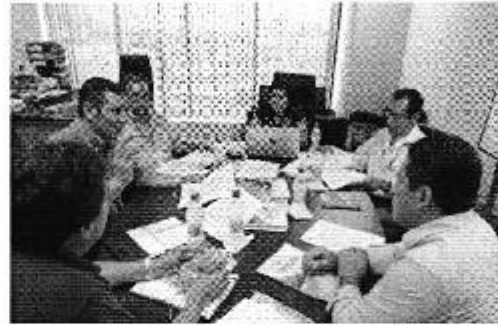
Fotografía 1. Reunión de trabajo con funcionarios de la DH – Jubones, GADP de El Oro y ARCA, Machala – El Oro