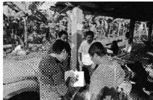
Fotografía 2. Recorrido por el canal de riego San Antonio de Pagua, con el Presidente de la Junta de Riego, funcionarios del Ministerio de Ambiente – El Oro, GAD Provincial de El Oro y la ARCA.