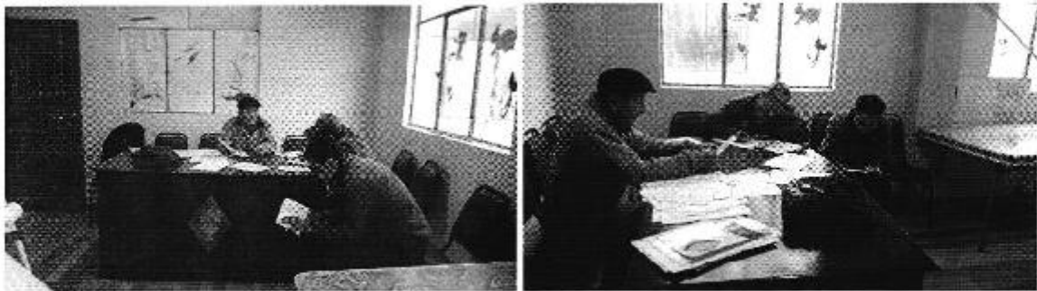
Fotografía 3. Reunión con el representante del Directorio de Aguas Nuncata Calpi