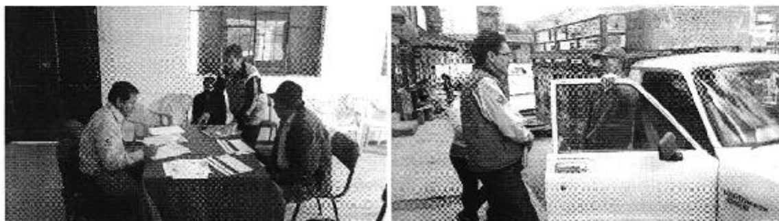
Fotografía 4. Reunión con los representantes del Directorio de Aguas de las Comunidades del Norte del Canal Secundario de la Parroquia Quimiag