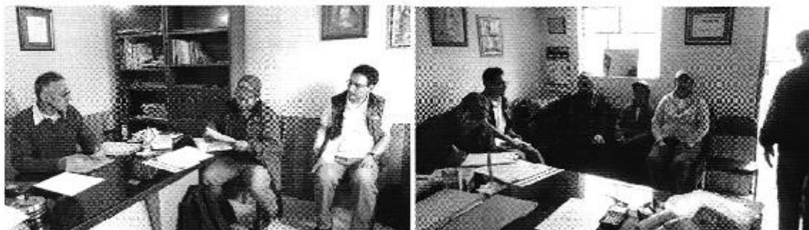
Fotografía 2. Reunión con Representantes del Directorio de Aguas de la Acequia El Vergel y medición de caudales