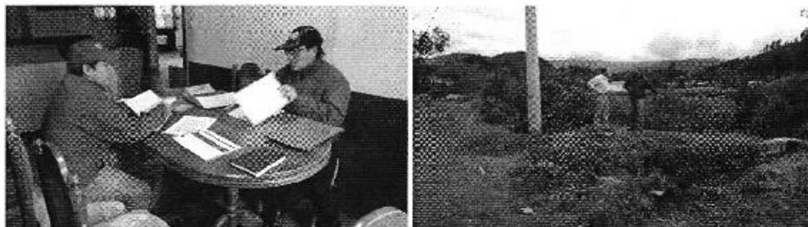
Fotografía 1. Reunión con los representantes del Directorio de Aguas de la Acequia El Puente.