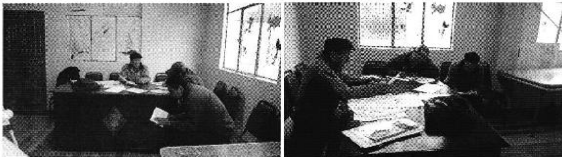
Fotografía 3. Reunión con el representante del Directorio de Aguas Nuncata Calpi