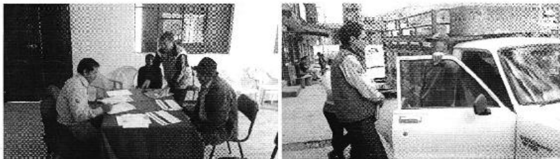
Fotografía 4. Reunión con los representantes del Directorio de Aguas de las Comunidades del Norte del Canal Secundario de la Parroquia Quimiag