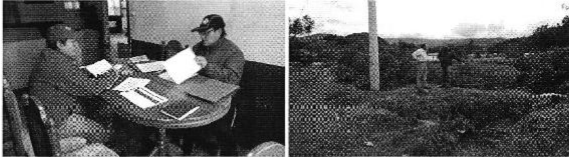
Fotografía 1. Reunión con los representantes del Directorio de Aguas de la Acequia El Puente.