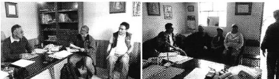
Fotografía 2. Reunión con Representantes del Directorio de Aguas de la Acequia El Vergel y medición de caudales