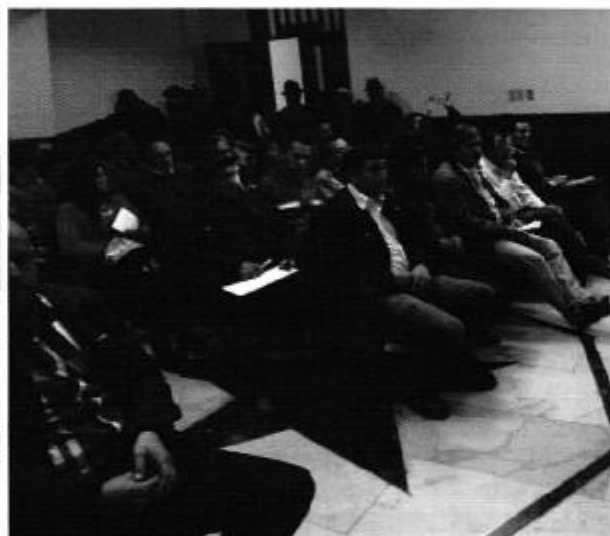
Director Técnico de Gestión Institucional de la ARCA y profesionales representantes a diferentes instituciones de la Provincia de Chimborazo; participando de la reunión técnica de análisis de la problemática del proyecto multipropósito Quimiag.