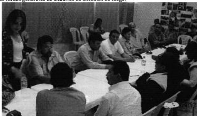
Director Técnico de Gestión Institucional de la ARCA, en reunión de trabajo con profesionales de SENAGUA, MAGAP, CONTRATISTA, FISCALIZADOR y representantes de las juntas de riego DEL CONTRATO DE REPARACIÓN Y REPOTENCIALIZACIÓN DE EQUIPOS DE BOMBEO Y DRENAJE de los sistemas de riego del río Daule.