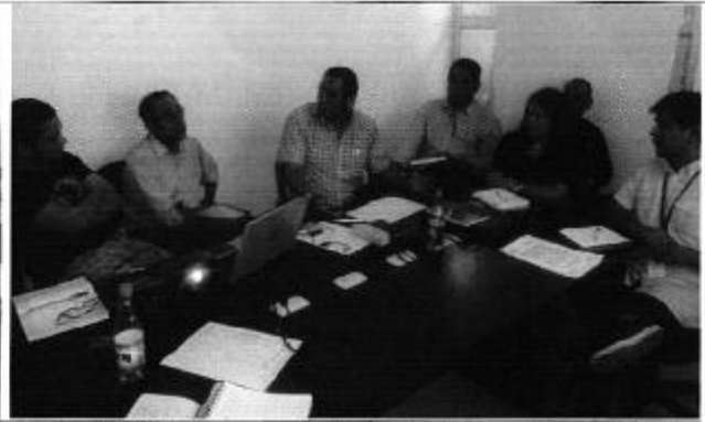
Director Técnico de Gestión Institucional de la ARCA, profesionales de SENAGUA (CAC) y profesionales de la EPA; analizando el "Plan de Organización y participación comunitaria para el acceso al agua"