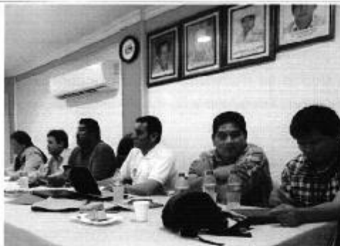
Director Técnico de Gestión Institucional de la ARCA, en reunión de trabajo con profesionales de SENAGUA, EPA y representantes de las juntas de riego miembros de la asociación Ecuatoriana de Juntas generales de Usuarios de sistemas de Riego.