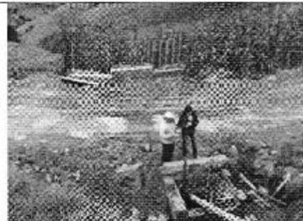
Fotografía 2. Muro de contención para evitar deslizamiento de la vía de tercer orden-Caso Celec