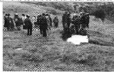
Fotografía 4. Sitio de captación de la JAAP Administrada por el Sr. Arachivala-Caso Quebrada Putcay