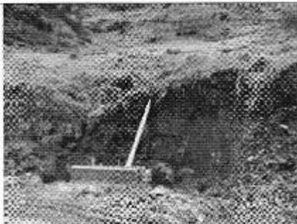
Fotografía 1. Tubería de drenaje-Caso Celec