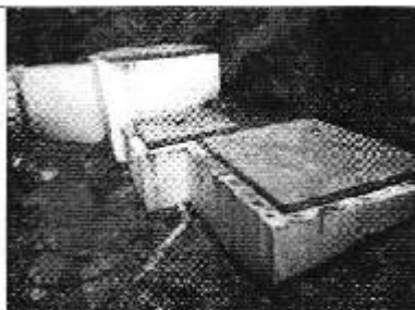
Fotografía 3. Sitio de captación de la JAAP Granda-Caso Quebrada Putcay