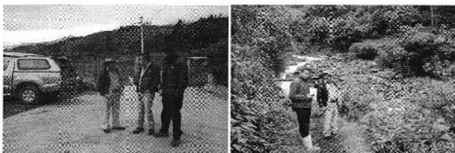
Fotografía 4. Der. Reunión de trabajo, Izq. Visita al sitio de captación del sistema de riego del Directorio de Aguas Tarau Pungales.