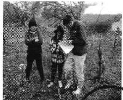
Fotografía 1. Der. Reunión de trabajo, Centro. Recorrido y constatación del estado del sistema de riego, Izq. Aplicación de encuestas a los consumidores del Directorio de Aguas de la Asociación de Trabajadores Agrícolas Ganshi El Altar.