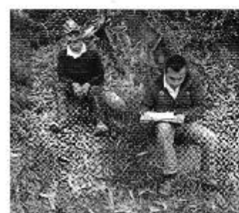
Fotografía 2. Der. Reunión de trabajo, Centro. Medición del caudal del sistema de riego, y Izq. Aplicación de encuestas a los consumidores del Directorio de Aguas de Pungal Santa Marianita