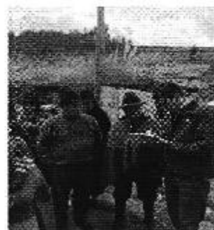
Fotografía 3. Der. Reunión de trabajo, y Izq. Aplicación de encuestas a los consumidores del Directorio de Aguas de la Compañía