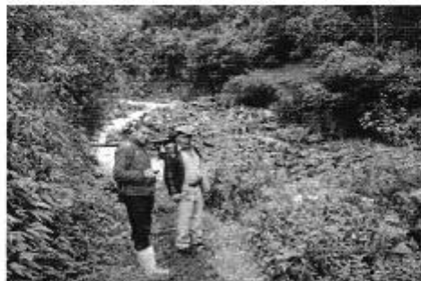
Fotografía 4. Der. Reunión de trabajo, Izq. Visita al sitio de captación del sistema de riego del Directorio de Aguas Tarau Pungales.