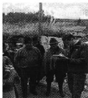
Fotografía 3. Der. Reunión de trabajo, y Izq. Aplicación de encuestas a los consumidores del Directorio de Aguas de la Compañía