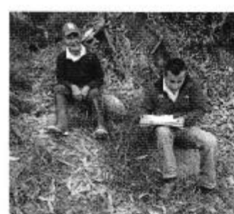
Fotografía 2. Der. Reunión de trabajo, Centro. Medición del caudal del sistema de riego, y Izq. Aplicación de encuestas a los consumidores del Directorio de Aguas de Pungal Santa Marianita