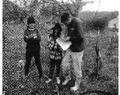
Fotografía 1. Der. Reunión de trabajo, Centro. Recorrido y constatación del estado del sistema de riego, Izo. Aplicación de encuestas a los consumidores del Directorio de Aguas de la Asociación de Trabajadores Agrícolas Ganshi El Altar

RECEPCIÓN DE DOCUMENTOS FECHA: 23-06-2016 HORA: 11:40 RECIBE: [Signature] FIRMA: [Signature]