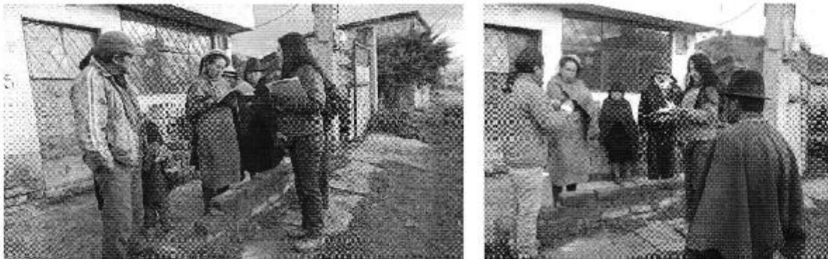
Fotografía 2. Reunión con los dirigentes del Directorio de Aguas de la Comuna Nitiluiza.