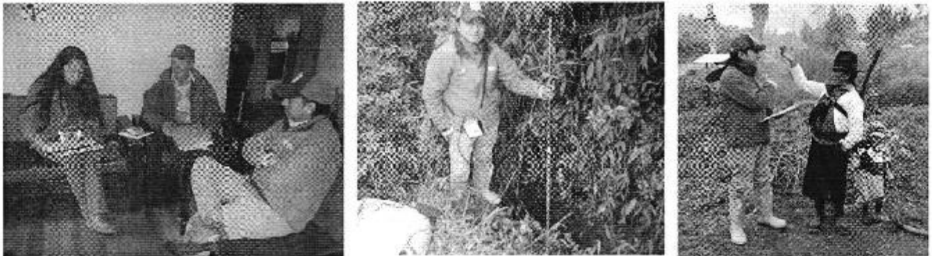
Fotografía 1. Recopilación de información, aforo de caudales y encuestas a consumidores del Directorio de Aguas del Barrio El Carmen.