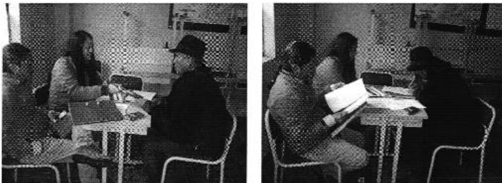
Fotografía 4. Recopilación de información del Directorio de Aguas de la Comuna San Antonio de Alao.