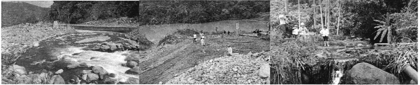
Fotos 1, 2 Y 3.- Inspección casos Hidrotambo, Cía. Minera COMIANGE S.A, - ACQUAD'OR C.A.