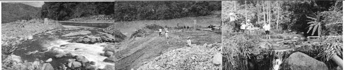
Fotos 1, 2 Y 3.- Inspección casos Hidrotambo, Cía. Minera COMIANGE S.A, - ACQUAD'OR C.A.