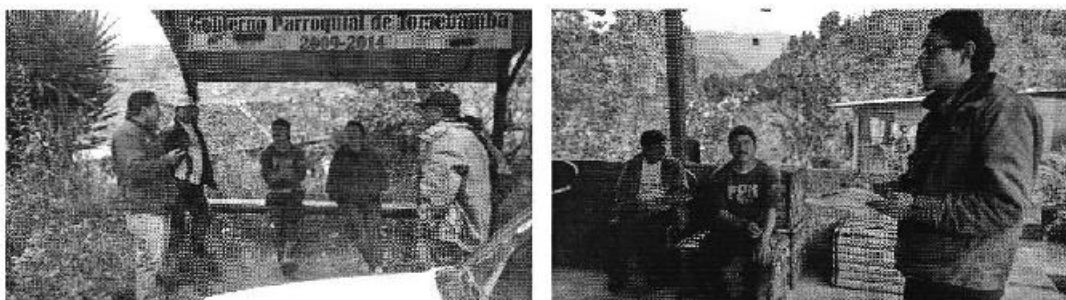
Fotografía 3. Reunión con los representantes del Canal de Riego Guagal y encuesta a consumidores