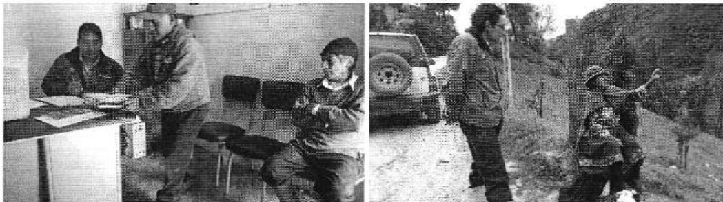
Fotografía 4. Reunión con los representantes del Canal de Riego San Agustín y encuesta a consumidores