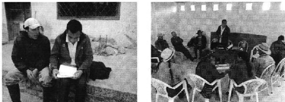
Fotografía 3. Der. Reunión de trabajo, y Izq. Aplicación de encuestas a los consumidores del Directorio del Canal de Riego Quillocachi - Tuzhicapa