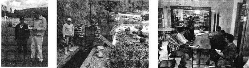
Fotografía 2. Der. Reunión de trabajo, Centro. Visita al sitio de captación y conducción, y Izq. Aplicación de encuestas a los consumidores del Directorio de Aguas del Canal de Riego San Joaquín