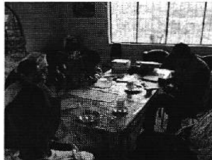
Fotografía 4. Der. Reunión de trabajo, Izq. Visita al sitio de captación del sistema de riego del Reservorio Severo Espinoza - Zhalli.