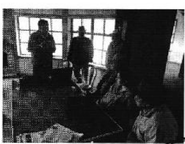
Fotografía 1. Der. Reunión de trabajo, Centro. Recorrido y constatación del estado del sistema de riego, Izq. Aforo de caudales del sistema de riego del Directorio de Aguas del Sistema de Riego Burgay Hondoturo.