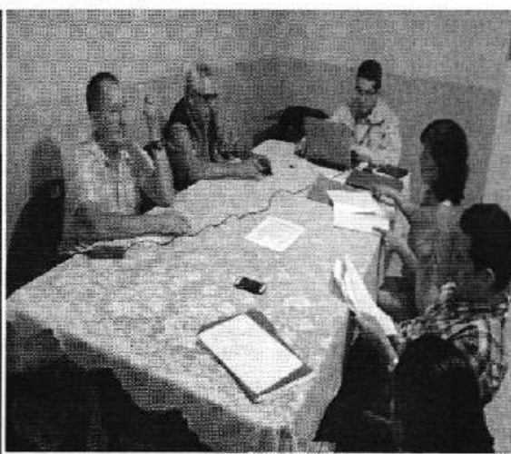
Ilustración 2. Elaboración del acta de control en la CAPAE.