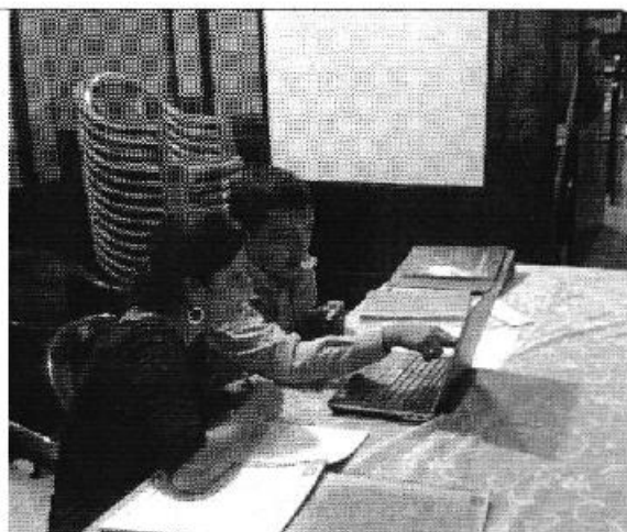
Ilustración 4. Explicativo del ingreso de datos en la herramienta para la evaluación.