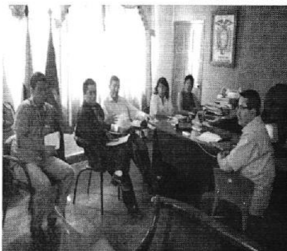
Ilustración 1. Presentación de la Institucionalidad en la oficinas del GADM de Echeandia.