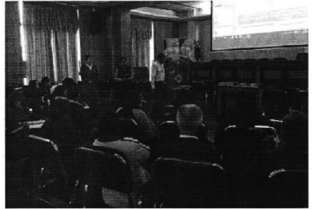
Fotografía 2. Participantes en la reunión provincial en la que se entregó los informes técnicos de los PSRC, Latacunga - Cotopaxi