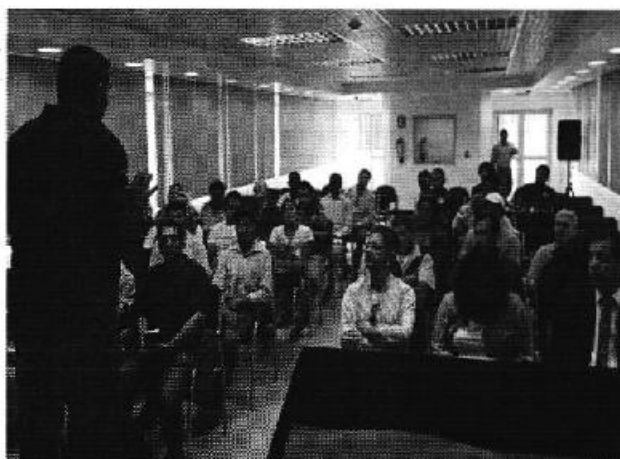
Fotografía 1. Participantes en la reunión provincial en la que se entregó los informes técnicos de los PSRC, Ibarra - Imbabura