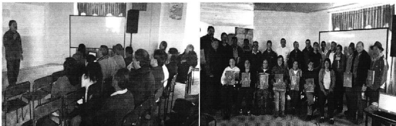
Fotografía 3. Participantes en la reunión provincial en la que se entregó los informes técnicos de los PSRC, Ambato - Tungurahua