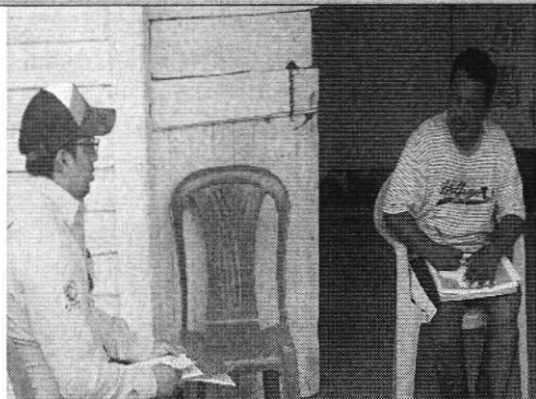
Entrega de notificaciones a usuarios Pagua.