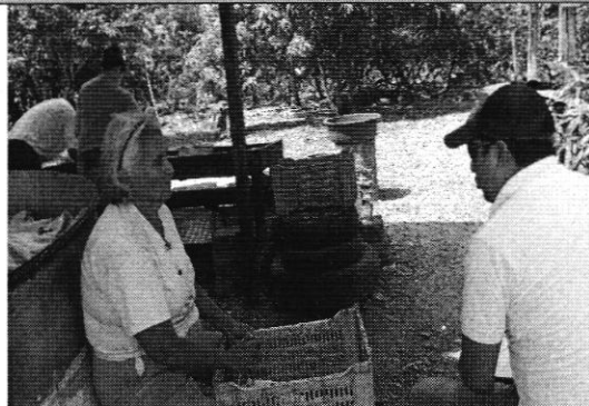
Entrega de notificaciones a usuarios Macaybí.