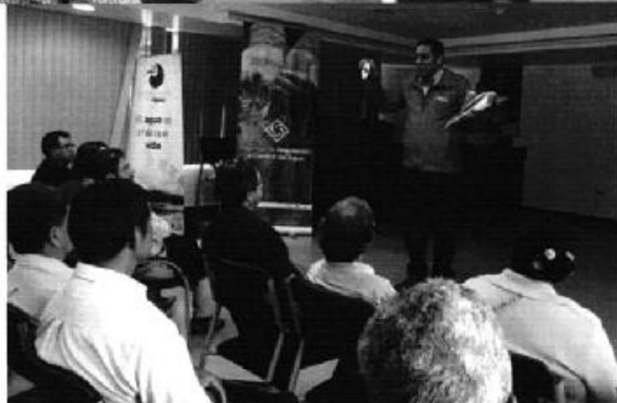
Profesionales de la Agencia de regulación y Control del Agua ARCA, ejecutando la reunión provincial en la que se entregó los informes técnicos de los Estados Situacionales de los PSRC, Ibarra - Imbabura