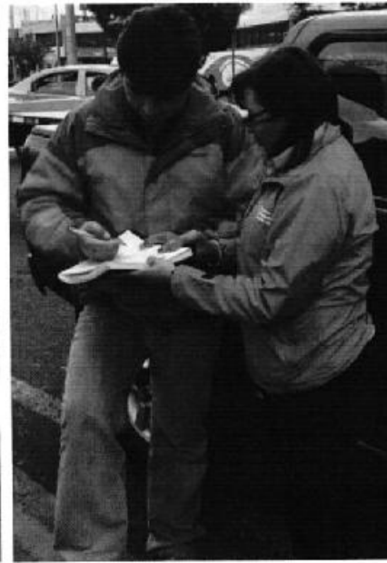
Profesionales de la Agencia de regulación y Control del Agua ARCA, ejecutando la reunión provincial en la que se entregó los informes técnicos de los Estados Situacionales de los PSRC, Ambato - Tungurahua