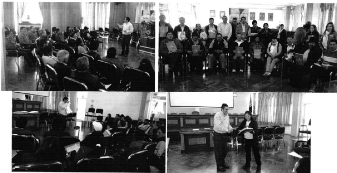
Profesionales de la Agencia de regulación y Control del Agua ARCA, ejecutando la reunión provincial en la que se entregó los informes técnicos de los Estados Situacionales de los PSRC, Latacunga - Cotopaxi