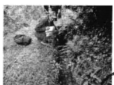
Fotografía 1. Izq. Reunión de trabajo, Centro. Recorrido y constatación del estado del sistema de riego, Der. Aforo de caudales del sistema de riego del Directorio de Aguas del Canal de Riego Santul Naste Santicay y Tomebamba