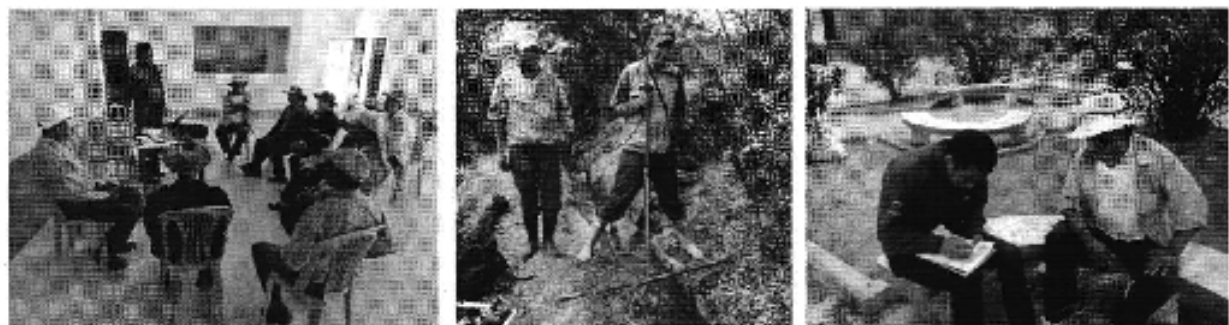
Fotografía 3. Izq. Reunión de trabajo, Centro. Aforo de caudales y Der. Aplicación de encuestas a los del Directorio de Aguas del Canal Uduzhe No. 1