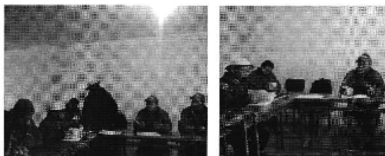
Fotografía 4. Izq. Reunión de trabajo con directivos de la OCOHID (Organizaciones Campesinas del Cañar)