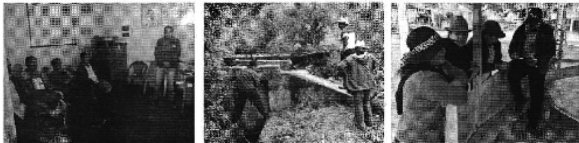
Fotografía 2. Izq. Reunión de trabajo, Centro. Visita al sitio de captación y conducción, y Der. Aplicación de encuestas a los consumidores de la Junta de Regantes San Luis