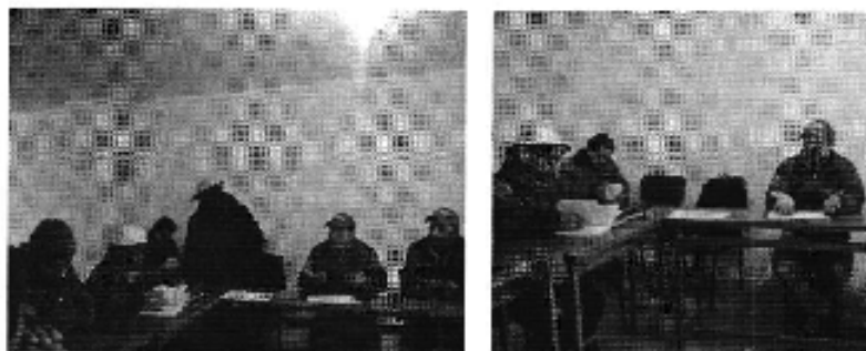
Fotografía 4. Izq. Reunión de trabajo con directivos de la OCOHID (Organizaciones Campesinas del Cañar)