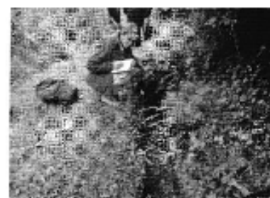
Fotografía 1. Izq. Reunión de trabajo, Centro. Recorrido y constatación del estado del sistema de riego, Des Aforo de caudales del sistema de riego del Directorio de Aguas del Canal de Riego Santul Naste Santicay y Tomebamba