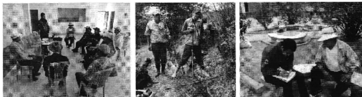
Fotografía 3. Izq. Reunión de trabajo, Centro. Aforo de caudales y Der. Aplicación de encuestas a los del Directorio de Aguas del Canal Uduzhe No. 1