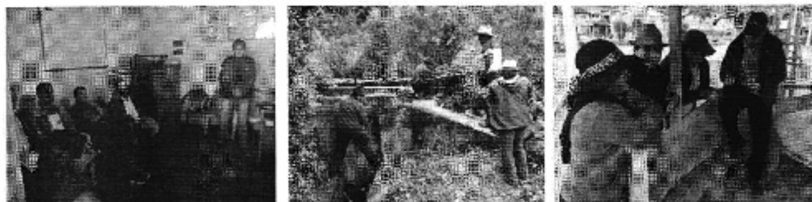
Fotografía 2. Izq. Reunión de trabajo, Centro. Visita al sitio de captación y conducción, y Der. Aplicación de encuestas a los consumidores de la Junta de Regantes San Luis