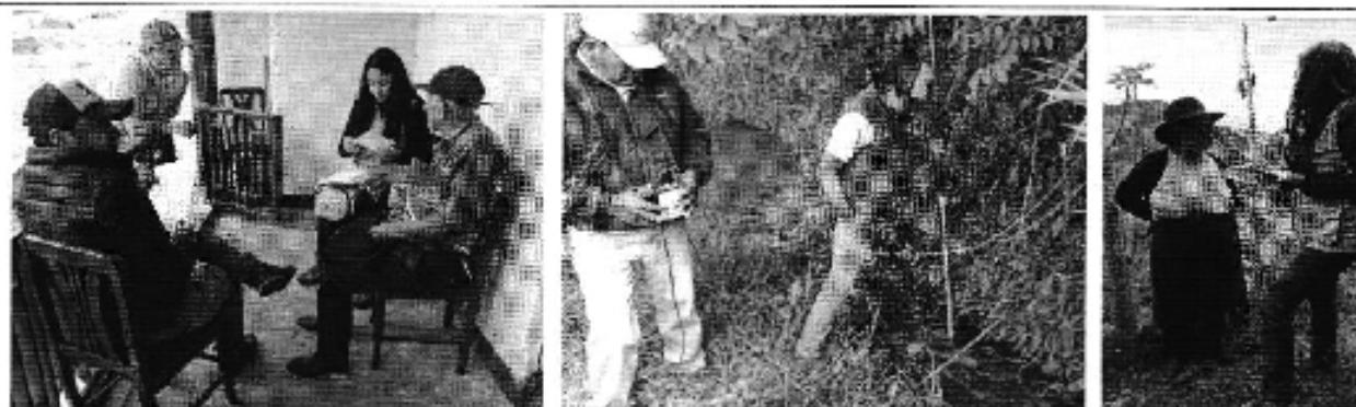
Fotografía 4. Recopilación de información, aforo de caudales y encuestas a consumidores del Directorio de Aguas de Portete.