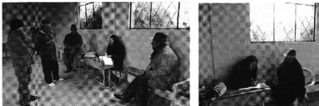
Fotografía 3. Recopilación de información, aforo de caudales y encuestas a consumidores del Directorio de Aguas del Canal de Cajontambo.