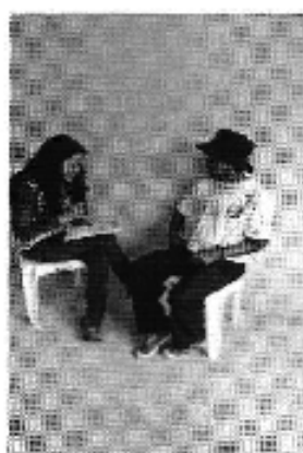
Fotografía 2. Recopilación de información, aforo de caudales y encuestas a consumidores del Directorio de Aguas de los Canales San José – Guisacéo – Las Cochas.