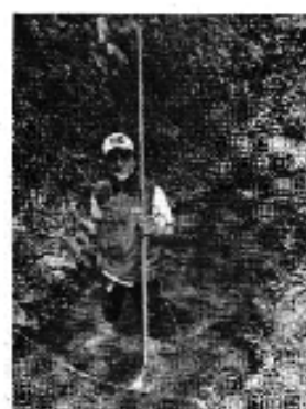
Fotografía 1. Recopilación de información, aforo de caudales y encuestas a consumidores del Directorio de Aguas del Canal Guashapamba.