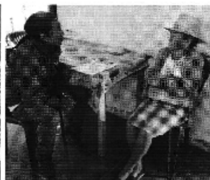
Fotografía 4. Recopilación de información, aforo de caudales y encuestas a consumidores de la Junta de Agua del Canal el Naque Taxiche.