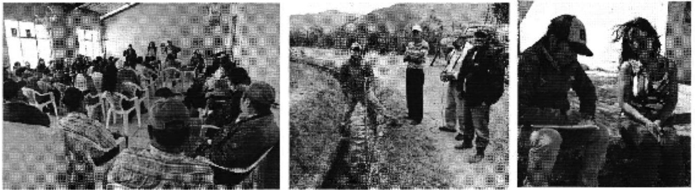
Fotografía 1. Recopilación de información, aforo de caudales y encuestas a consumidores de la Junta General de Usuarios del Sistema de Riego Sanambay Jimbura.