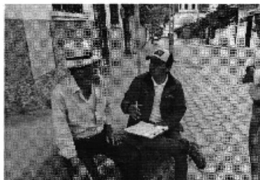
Fotografía 3. Recopilación de información, aforo de caudales y encuestas a consumidores del Directorio de Aguas del Canal El Moquillo.