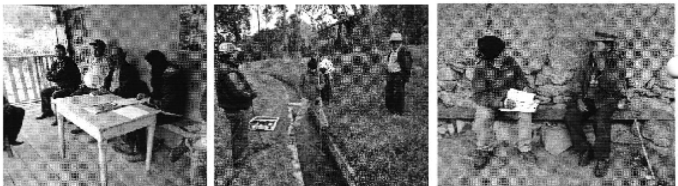
Fotografía 2. Recopilación de información, aforo de caudales y encuestas a consumidores del Directorio de Aguas del Canal de Riego Chantaco Chichaca.