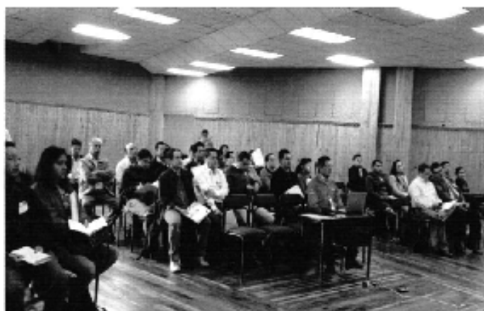
Ilustración 2. Taller de capacitación realizado en Cuenca para los GADM de la Demarcación Hidrográfica de Santiago.