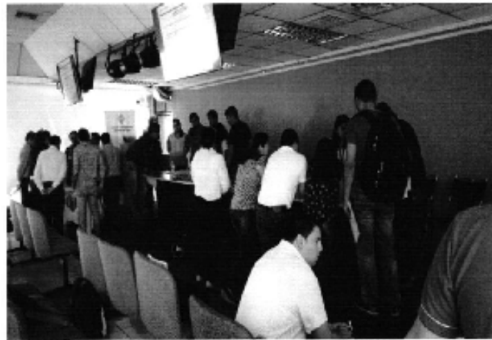
Ilustración 4. Taller de capacitación sobre la Regulación 003, realizado en El Coca a los representantes de los GADM de la Demarcación Hidrográfica de Napo.