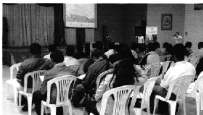
Ilustración 1. Taller Demarcación Hidrográfica de Puyango-Catamayo, ciudad de Catamayo.