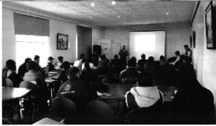
Ilustración 3. Taller de capacitación de la Regulación 003 realizado para los representantes de los GADM de la Demarcación de Hidrográfica de Pastaza en la ciudad de Ambato.