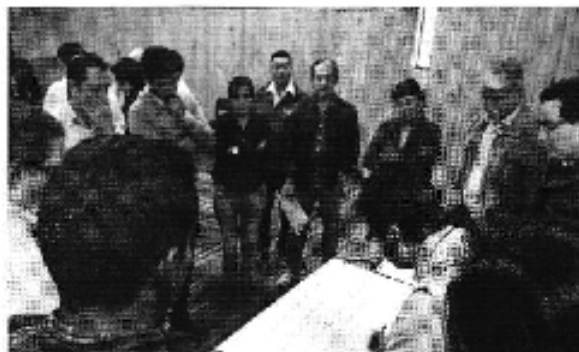
Ilustración 2. Taller realizado en la ciudad de Cuenca (D.H.).