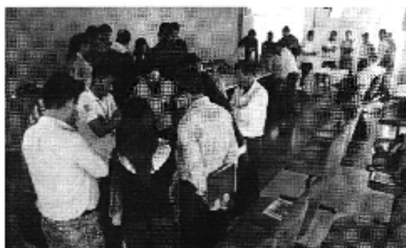
Ilustración 4. Taller realizado en la ciudad de Francisco de Orellana (D.H. Napo).