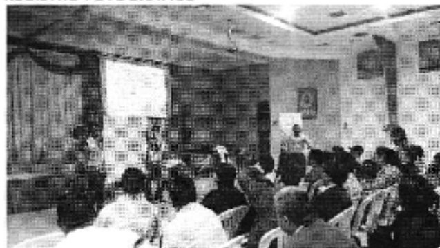
Ilustración 1. Taller realizado en la ciudad de Catamayo (D.H. Puyango- Catamayo).