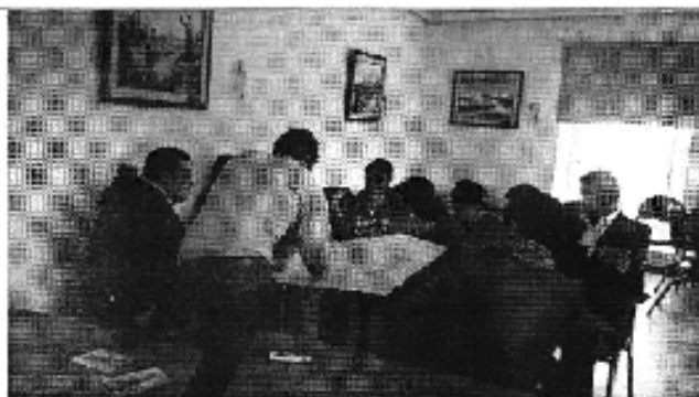
Ilustración 3. Taller realizado en la ciudad de Ambato (D.H. Pastaza).