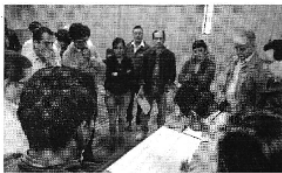
Ilustración 2. Taller realizado en la ciudad de Cuenca (D.H. ).