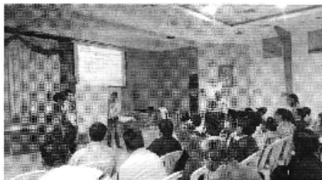
Ilustración 1. Taller realizado en la ciudad de Catamayo (D.H. Puyango- Catamayo).