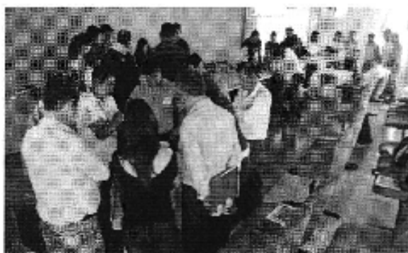
Ilustración 4. Taller realizado en la ciudad de Francisco de Orellana (D.H. Napo).