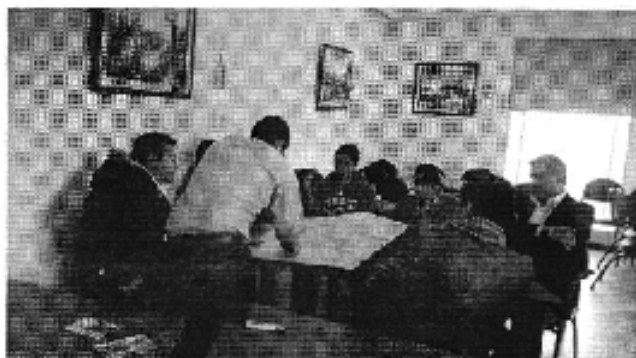
Ilustración 3. Taller realizado en la ciudad de Ambato (D.H. Pastaza).