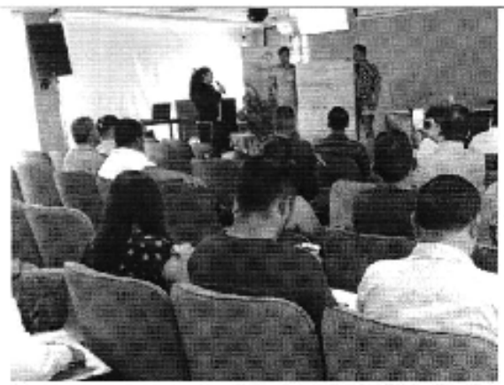
Foto 4. Actividad Grupal Parámetros de Tarifas en el Taller realizado en El Coca (D.H. Napo).