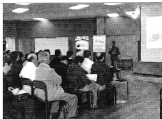
Foto 2. Presentación de la ARCA Taller en la ciudad de Cuenca (D.H. Santiago).