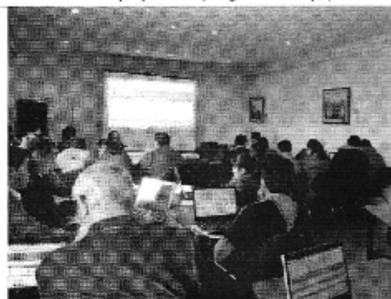
Foto 3. Capacitación del uso de herramientas Taller Ambato (D.H. Pastaza).