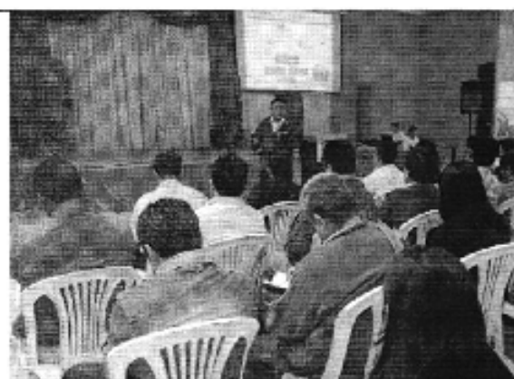
Foto 1. Inicio del Taller realizado en la ciudad de Catamayo (D.H. Puyango Catamayo)