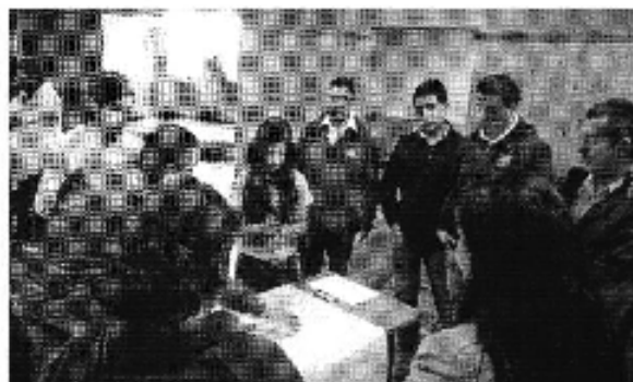
Ilustración 2. Taller realizado en la ciudad de Cuenca (D.H. ).