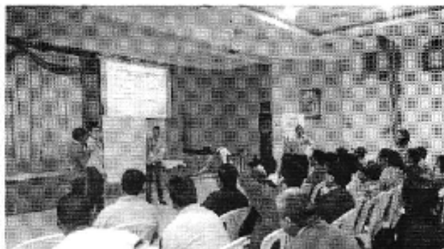
Ilustración 1. Taller realizado en la ciudad de Catamayo (D.H. Puyango- Catamayo).