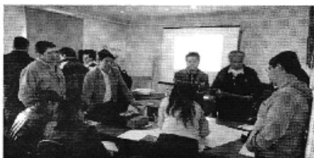
Ilustración 3. Taller realizado en la ciudad de Ambato (D.H. Pastaza).