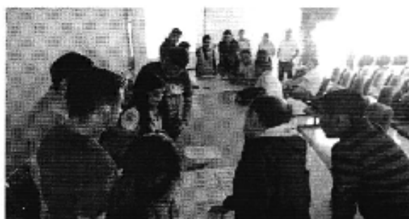
Ilustración 4. Taller realizado en la ciudad de Francisco de Orellana (D.H. Napo).