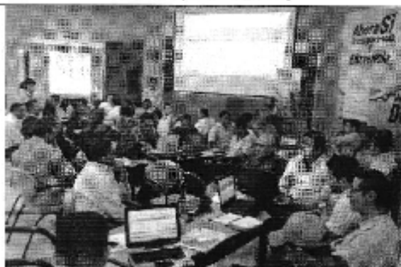
Foto 3. Capacitación del uso de herramientas Taller Quevedo (D.H. Guayas Norte).