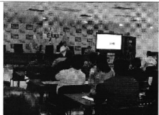
Foto 2. Presentación de la ARCA Taller en la ciudad de Guayaquil (D.H. Guayas Sur).