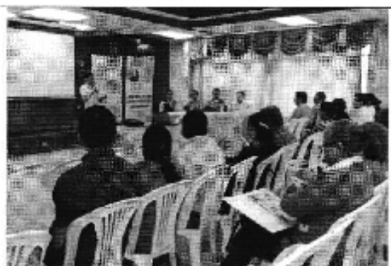
Foto 4. Presentación de la Agenda en el Taller realizado en la ciudad de Portoviejo (D.H. Manabí).