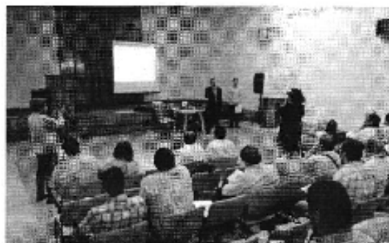
Foto 1. Inicio del Taller realizado en la ciudad de Machala (D.H. Jubones)