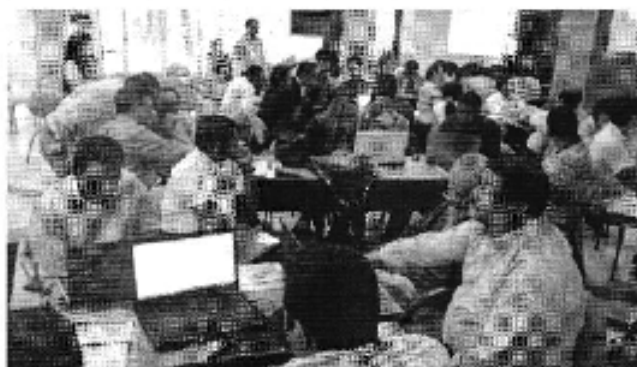
Ilustración 3. Taller realizado en la ciudad de Quevedo (D.H. Guayas Norte).