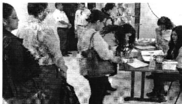
Ilustración 2. Taller realizado en la ciudad de Guayaquil (D.H. Guayas Sur).