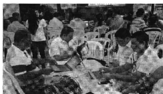
Ilustración 4. Taller realizado en la ciudad de Portoviejo (D.H. Manabí).