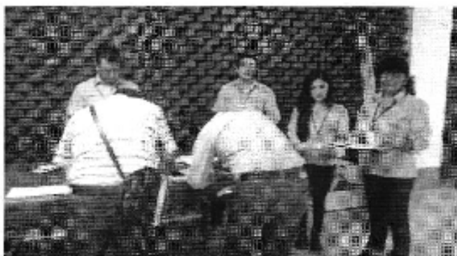
Ilustración 1. Taller realizado en la ciudad de Machala (D.H. Jubones). Inscripción de participantes