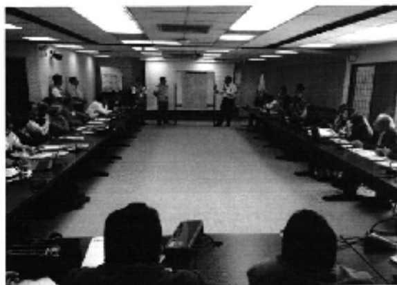
Ilustración 4. Taller de la Regulación Nro. DIR-ARCA-RG-003-2016 en la ciudad de Quito.