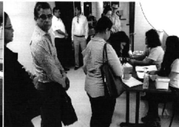
Ilustración 1. Taller Regulación Nro. DIR-ARCA-RG-003-2015 en la ciudad de Guayaquil