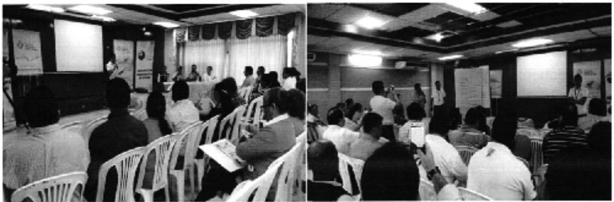
Ilustración 3. Taller de la Regulación Nro. DIR-ARCA-RG-003-2016 en la ciudad de Portoviejo.