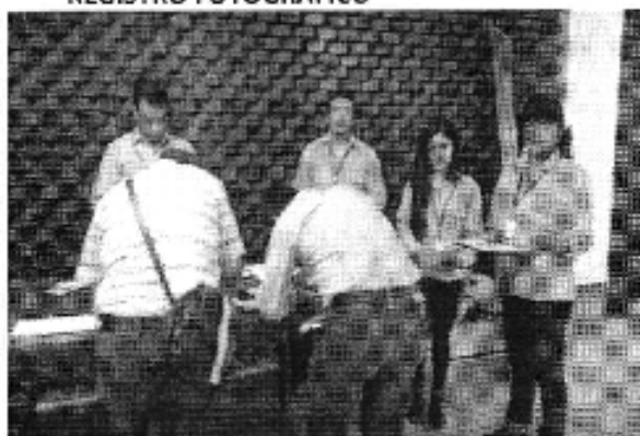
Ilustración 1. Taller realizado en la ciudad de Machala (D.H.Jubones).Inscripción de participantes