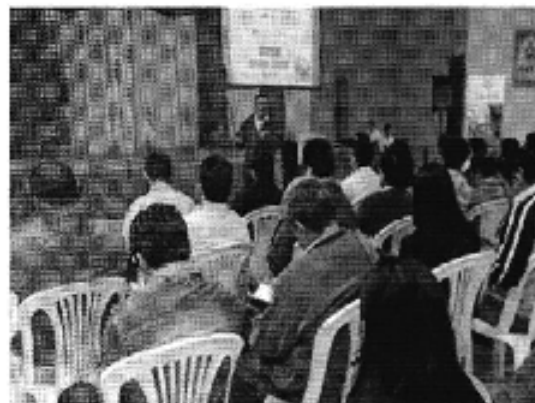
Ilustración 4. Taller realizado en la ciudad de Portoviejo (D.H.Manabí).