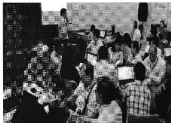
Ilustración 2. Taller realizado en la ciudad de Guayaquil (D.H.Guayas Sur).