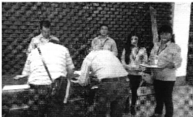
Ilustración 1. Taller realizado en la ciudad de Machala (D.H.Jubones).Inscripción de participantes