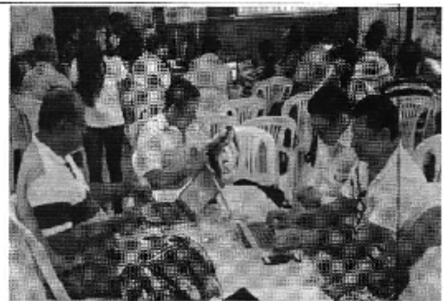
Ilustración 4. Taller realizado en la ciudad de Portoviejo (D.H. Manabí).