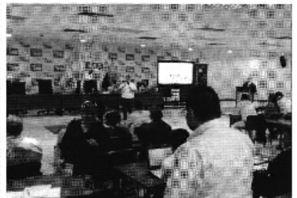
Ilustración 2. Taller realizado en la ciudad de Guayaquil (D.H.Guayas Sur).