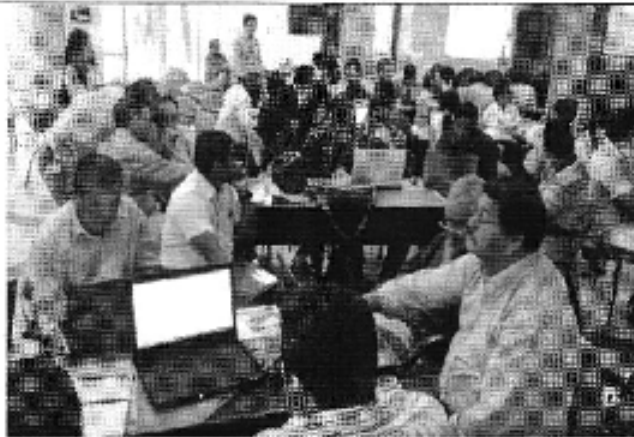
Ilustración 3. Taller realizado en la ciudad de Quevedo (D.H. Guayas Norte).