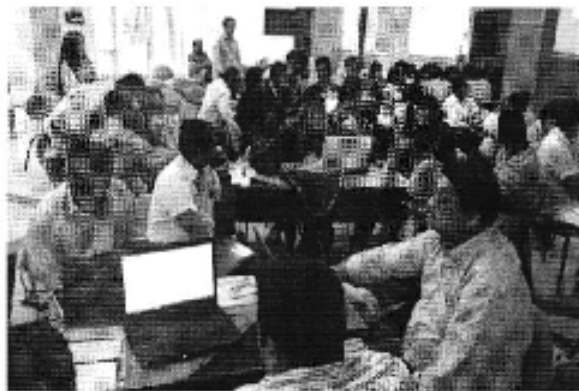
Ilustración 1. Taller realizado en la ciudad de Machala (D.H. Jubones).Inscripción de participantes