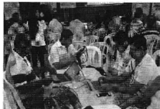
Ilustración 2. Taller realizado en la ciudad de Guayaquil (D.H. Guayas Sur).