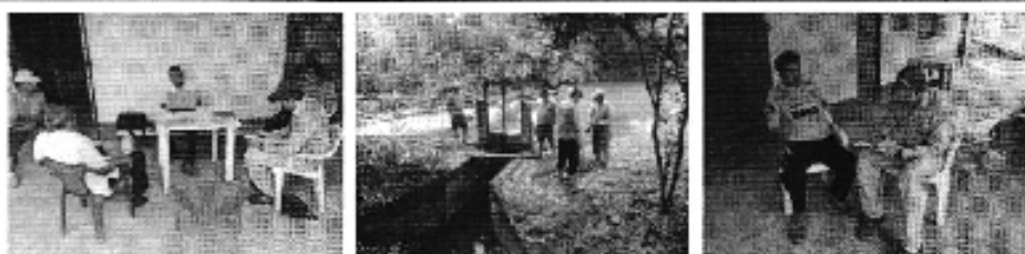
Fotografía 3. Izq. Reunión de trabajo, Centro. Visita al sitio de captación y Der. Aplicación de encuestas a los consumidores del Directorio de Aguas del Canal de Riego Sitio Palenque-La Sabana.