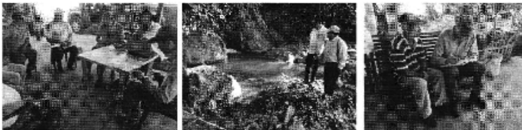
Fotografía 2. Izq. Reunión de trabajo, Centro. Visita al sitio de captación y Der. Aplicación de encuestas a los consumidores del Directorio de Aguas de la Sociedad Muyuyacu