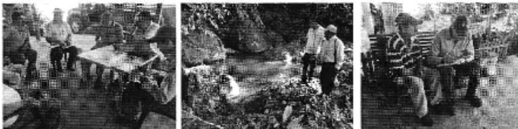
Fotografía 2. Izq. Reunión de trabajo, Centro. Visita al sitio de captación y Der. Aplicación de encuestas a los consumidores del Directorio de Aguas de la Sociedad Muyuyacu