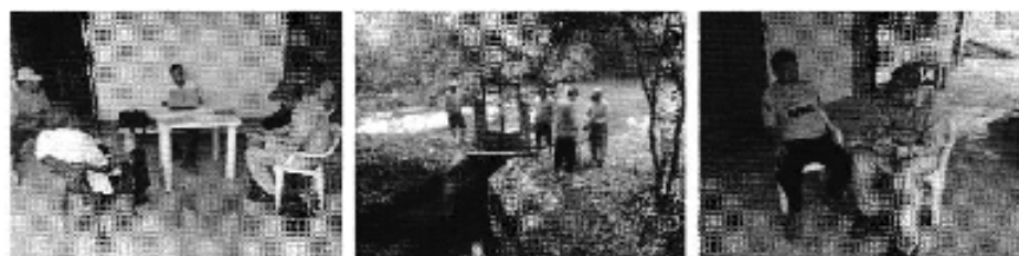
Fotografía 3. Izq. Reunión de trabajo, Centro. Visita al sitio de captación y Der. Aplicación de encuestas a los consumidores del Directorio de Aguas del Canal de Riego Sitio Palenque-La Sabana.