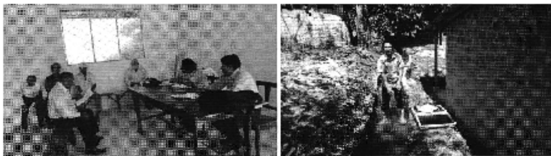
Fotografía 2. Reunión con los representantes de la Asociación de Trabajadores Agrícolas Sabiango y medición de caudales