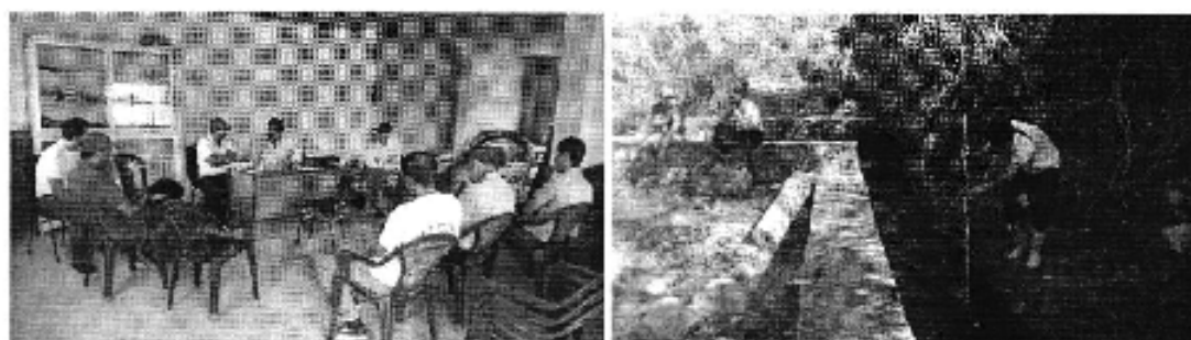
Fotografía 3. Reunión con los representantes de la Junta de Regantes del canal de Riego Guapales y medición de caudales.