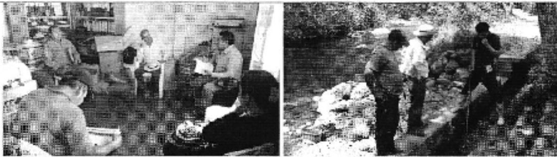
Fotografía 1. Reunión con los representantes del Directorio de Aguas de las Acequias de la microcuenca baja del Río Uchima y medición de caudales