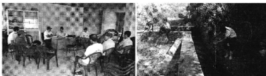
Fotografía 3. Reunión con los representantes de la Junta de Regantes del canal de Riego Guapalas y medición de caudales.