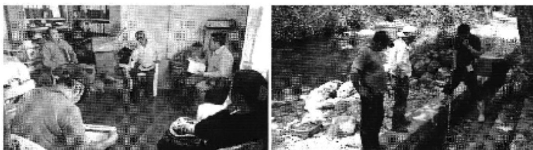
Fotografía 1. Reunión con los representantes del Directorio de Aguas de las Acequias de la microcuenca baja del Río Uchima y medición de caudales