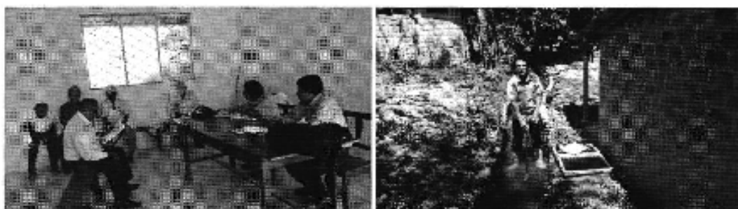
Fotografía 2. Reunión con los representantes de la Asociación de Trabajadores Agrícolas Sabiango y medición de caudales