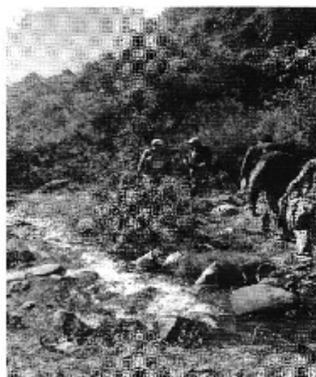
Ilustración 2. Recorrido por las fuentes de captación superficial con el fin de constatar los caudales autorizados.