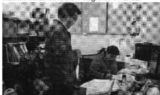
Ilustración 5. Firmas de actas de control por los representantes de la JAAP Regional Vinchoa.