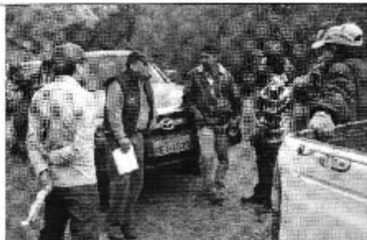
Ilustración 4. Personal técnico en debate en búsqueda de posibles soluciones.