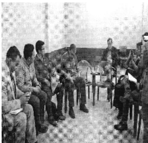
Ilustración 1. Reunión de trabajo con los representantes de la JAAP Regional Vinchoa, empresa pública EMAPAG, funcionarios del MICSE, SENAGUA, ARCA, para conocer la problemática de la Regional.