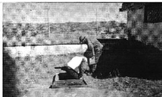
Ilustración 3. Revisión del Sistema de agua potable y alcantarillado de la JAAP Regional Vinchoa.