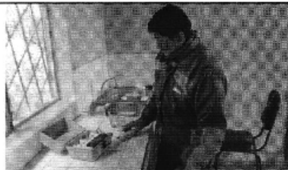
Ilustración 3. Inspección conjunta con operadores de AMUS y ETAPA-EP del sistema de agua que abastece a 11 barrios de la parroquia Sinincay.