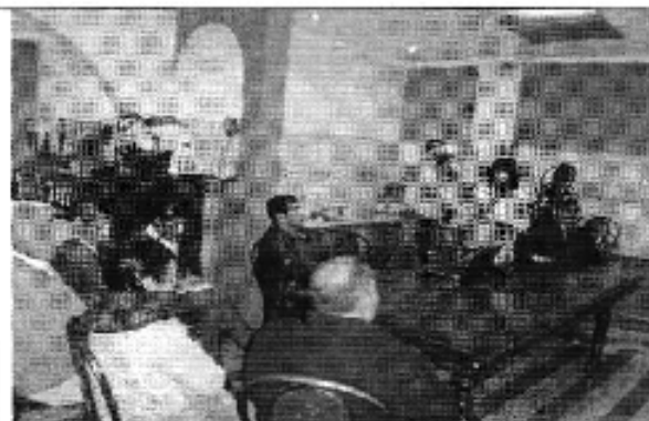
Ilustración 2. Presentación de la Institucionalidad de la ARCA