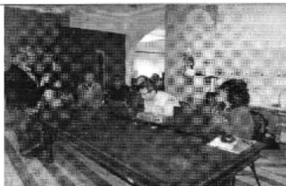
Ilustración 1. Participación del presidente de AMUS