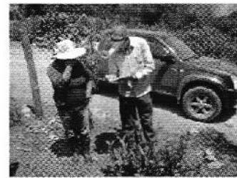
Fotografía 3. Izq. Reunión de trabajo, Centro. Visita al sitio de captación y Der. Aplicación de encuestas a los consumidores del Directorio de Riego Corralitos San Gerardo 10 de Julio.