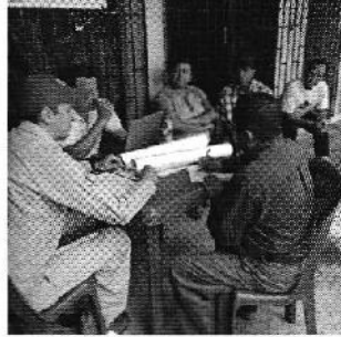
Fotografía 2. Reunión de trabajo con directivos de la Asociación Productora Agropecuaria San Juan