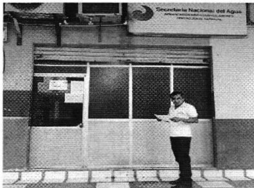
Fotografía 1. Recopilación de información, referente a las resoluciones administrativas de los PSRC, CAC Naranjal