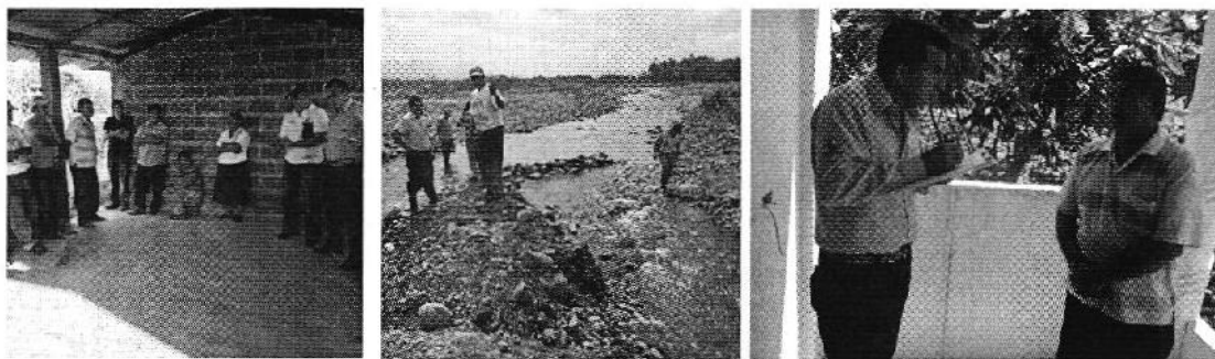
Fotografía 4. Izq. Reunión de trabajo, Centro. Visita al sitio de captación y Der. Aplicación de encuestas a los consumidores de LA Asociación Agropecuaria Nueva Jerusalén.