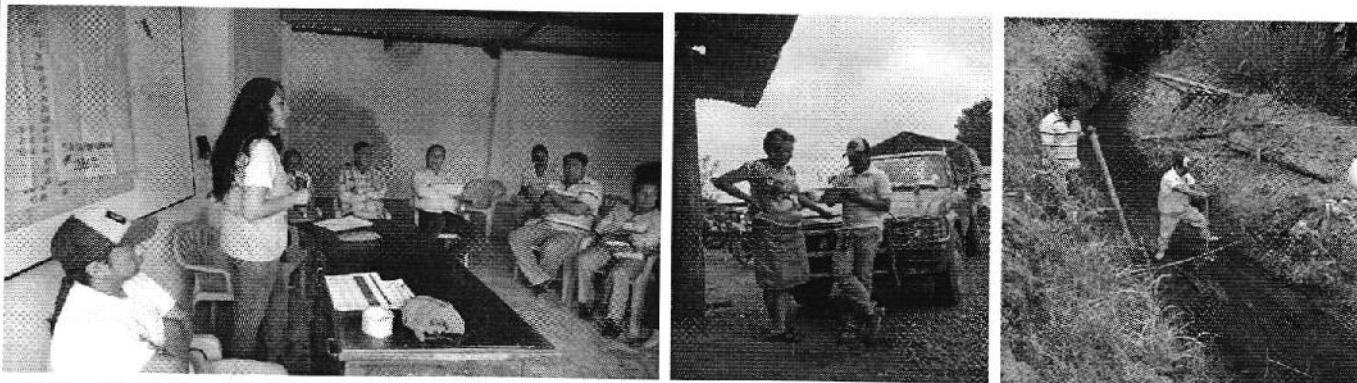
Fotografía 2. Recopilación de información, aforo de caudales y encuestas a consumidores de la Cooperativa Agrícola 13 de Noviembre.