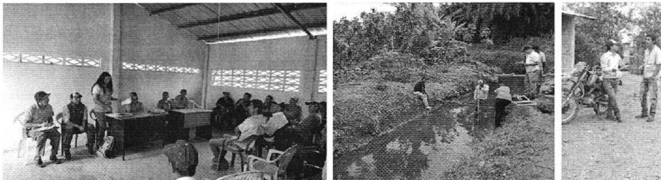
Fotografía 3. Recopilación de información, aforo de caudales y encuestas a consumidores de la Asociación de Pequeños Productores Agropecuarios Tres Haciendas.