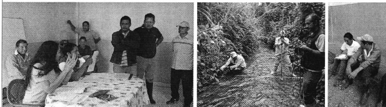
Fotografía 4. Recopilación de información, aforo de caudales y encuestas a consumidores de la Cooperativa Doraliza.