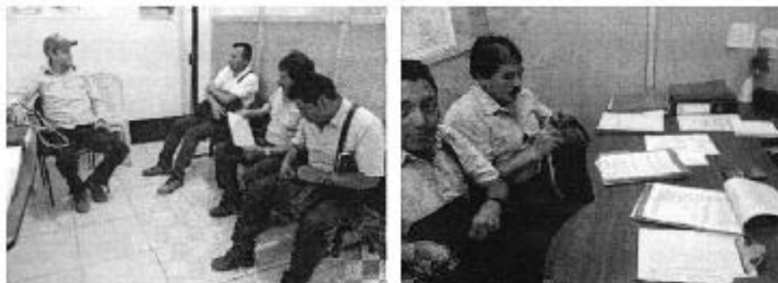
Fotografía 4. Reunión de trabajo, Centro de Atención Ciudadana Naranjal.