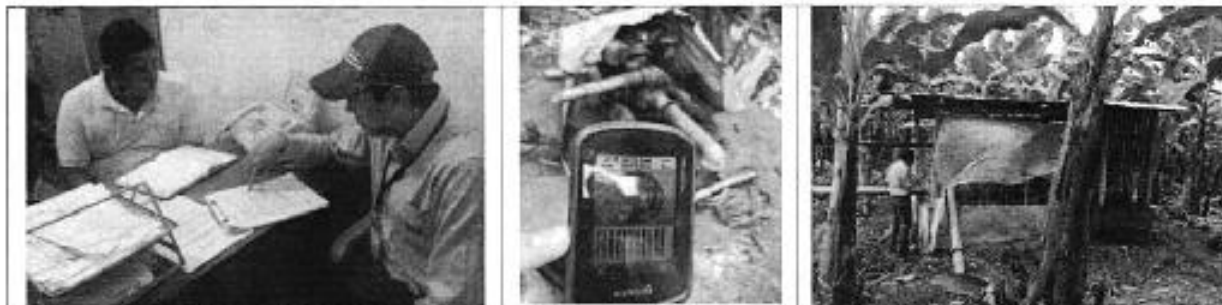
Fotografía 2. Izq. Reunión de trabajo, Centro. Georeferenciación punto IPRH, y Der.. Sistema de bombeo Sr. Julio Simbala.