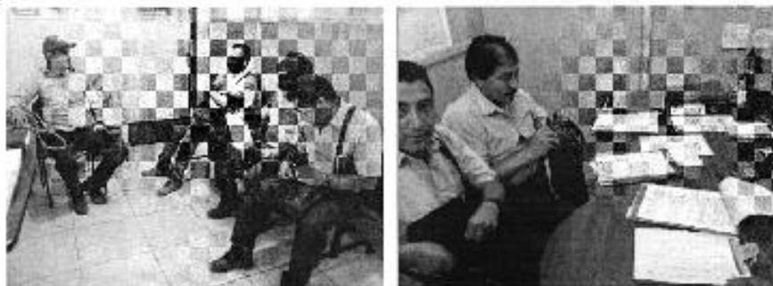
Fotografía 4. Reunión de trabajo, Centro de Atención Ciudadana Naranjal.