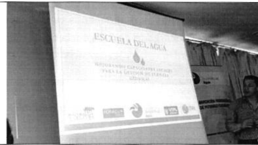
Fotografía 4. Presentación Escuela del Agua.