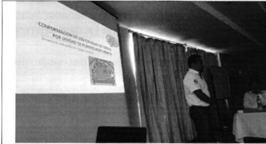
Fotografía 1. Presentación conformación de los consejos de cuenca y perspectivas frente al cambio climático