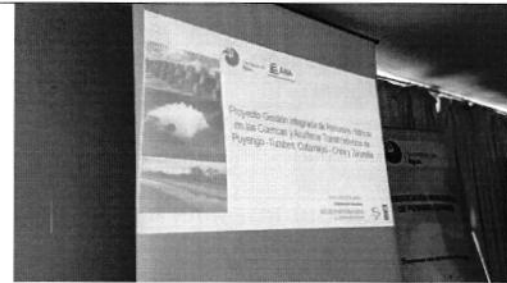
Fotografía 2. Presentación Gestión Integrada de los Recursos Hídricos de las Cuencas Transfronterizas de los Ríos Catamayo-Chira, Puyango-Tumbes Zarumilla