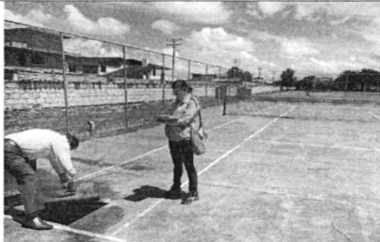
Foto 1. Recorrido al almacenamiento de agua de pozo de la Hostería Rumipamba de las Rosas