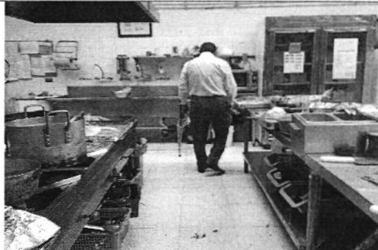
Foto 2. Recorrido a instalaciones de la Hostería Rumipamba de las Rosas