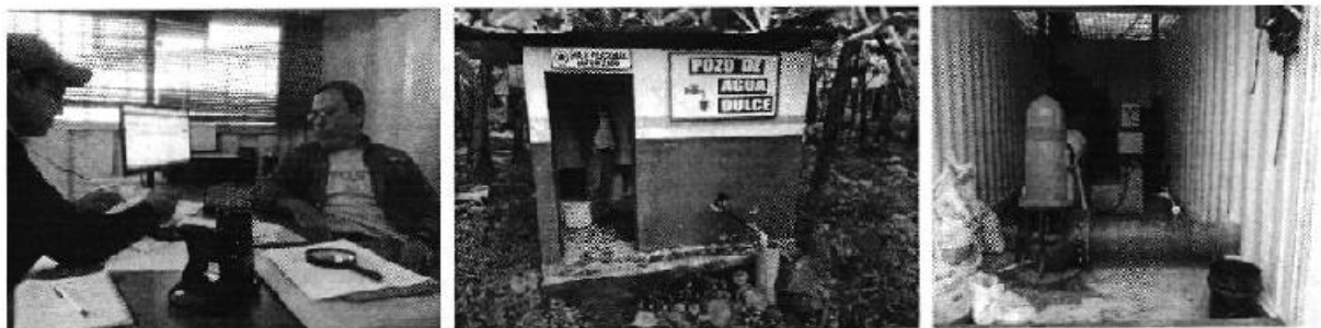
Fotografía 5. Izq. Reunión de trabajo, Centro Punto Iprh; Der. Sistema de Bombeo Sr. Pedro Garaycoa.