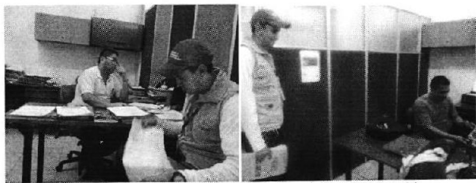
Fotografía 1. Reunión de trabajo, Centro de Atención Ciudadana Naranjal.