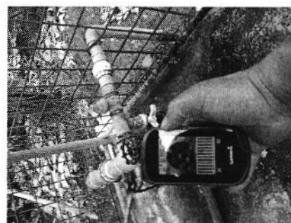
Sitio donde se ubica la bomba de succión, Hacienda Las Gardenias.