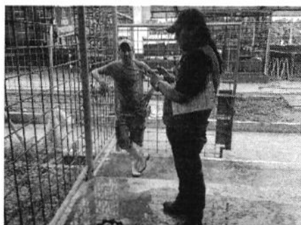
Hacienda Las Gardenias de de la Aso. Agrícola La Pagua