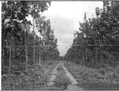
Hacienda Sta. Elena de Reybanpac