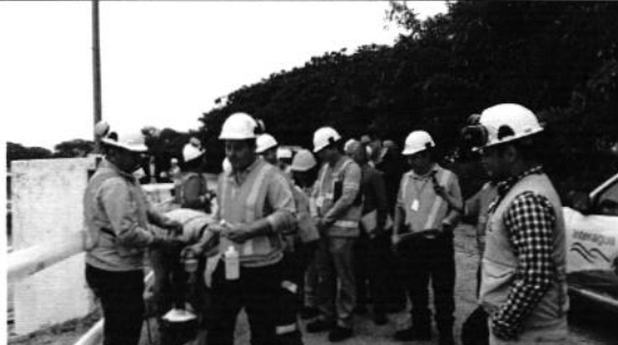
Foto 2. Asistentes a los monitoreos el día jueves 20 de octubre. Los asistentes fueron representantes de: Senagua, Laboratorio Inamhi, MAE, MSP, Interagua y ARCA.