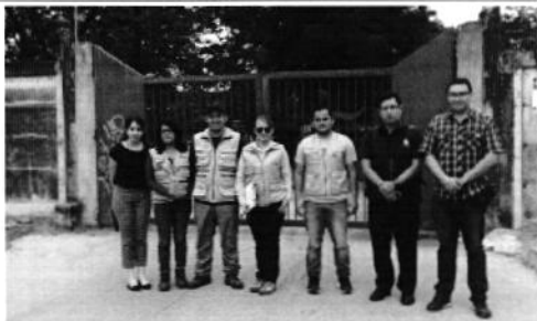
Foto 1. Fotografía de los asistentes del día miércoles 19 de Octubre a la PTAR de Interagua. Los asistentes fueron representantes de: La denunciante, Laboratorio Inamhi, MAE, MSP y ARCA.