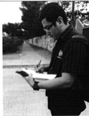
Foto 4. Firma de actas de asistencia