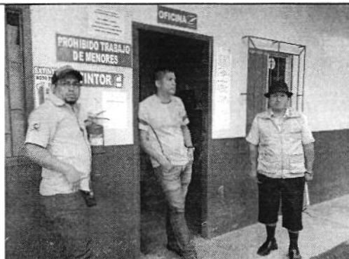
Oficina Hacienda Playón