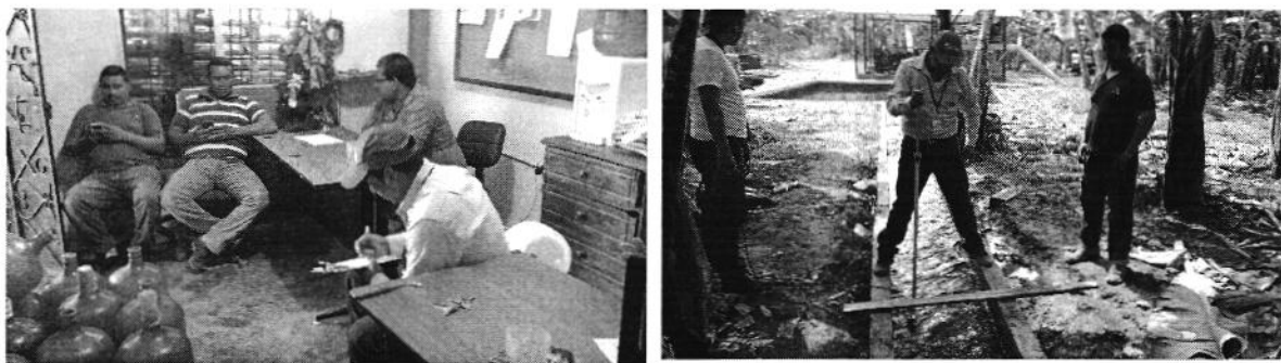
Fotografía 4. Izq. Entrega de oficio, Der. Aforo de caudal en la captación