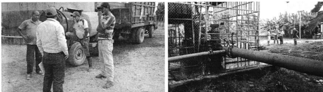
Fotografía 2. Izq. Entrega de oficio, Der. Visita al sitio de captación y conducción